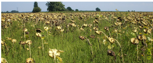
Parcelle de tournesol en forte situation d'invasion d'ambroisie

Exemple : sur tournesol, perte de 3q/ha pour 10 ambrosies au m 2 (Chollet, 2012)