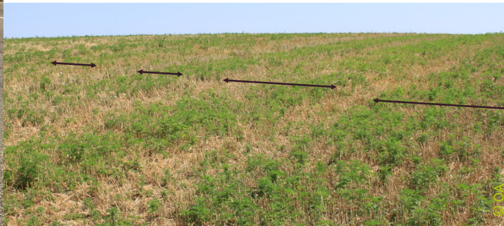
Repousses d'ambrosies liées à la menue paille laissée par la moissonneuse-batteuse de la récolte de tournesol de l'année précédente